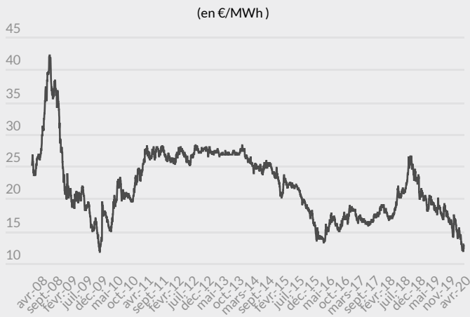
Évolution du prix du gaz depuis 2008