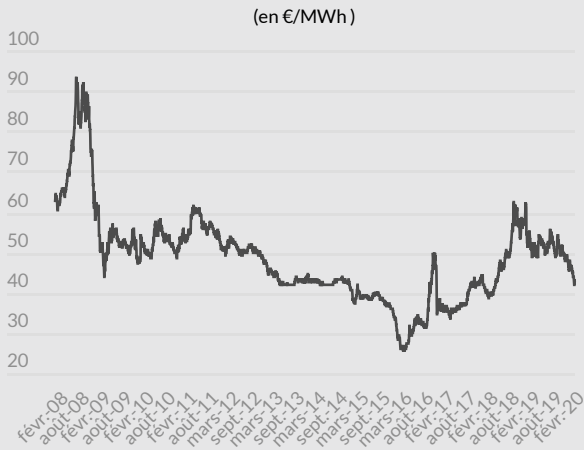
Évolution du prix de l'électricité depuis 2008